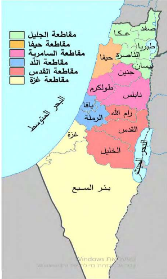
(أقضية فلسطين قبل النكبة)

كانت فلسطين حتى النكبة 1948 تُقسم إلى 16 قضاءً وهي كالتالي : يافا - نابلس - غزة - عكا - طولكرم - طبريا - صفا - رام الله - حيفا - جنين - بيسان - بئر السبع - الناصرة - القدس - الرملة - الخليل. لم يقتصر التزييف، بعد الاحتلال والتهجير التاريخي والجغرافي والديمقراطي على مجرد تغيير أسماء المدن والقرى وإنما على مستوى الأولوية والأفضية جميعها، علما أن الأسماء الأصلية والأصلية لا تختفي بسهولة، لكن التعويل الصهيوني على عامل الوقت وفي غياب التوعية والتوجيه المناسبين سيكون عاملاً أساسياً في إحداث نوع من الفراغ المعرفي على حقيقة المسميات والأسماء التي تثبت بحق لمن هذه البلاد، فإن سياسة "عبرنة" الأسماء طالت أكثر من 9000 مكان في فلسطين. كانت فلسطين مقسمة قبل النكبة الى 6 أولوية أو مقاطعات وفيها ال 16 قضاءً حسب الجدول التالي :